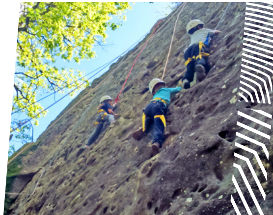
Ludisports Pleine Nature