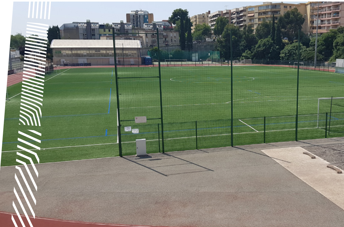
Stade de foot