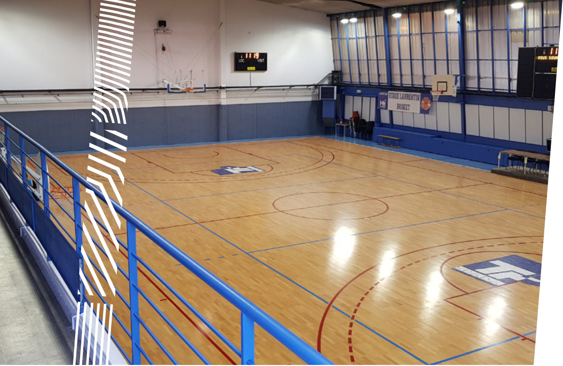
Salle de basket